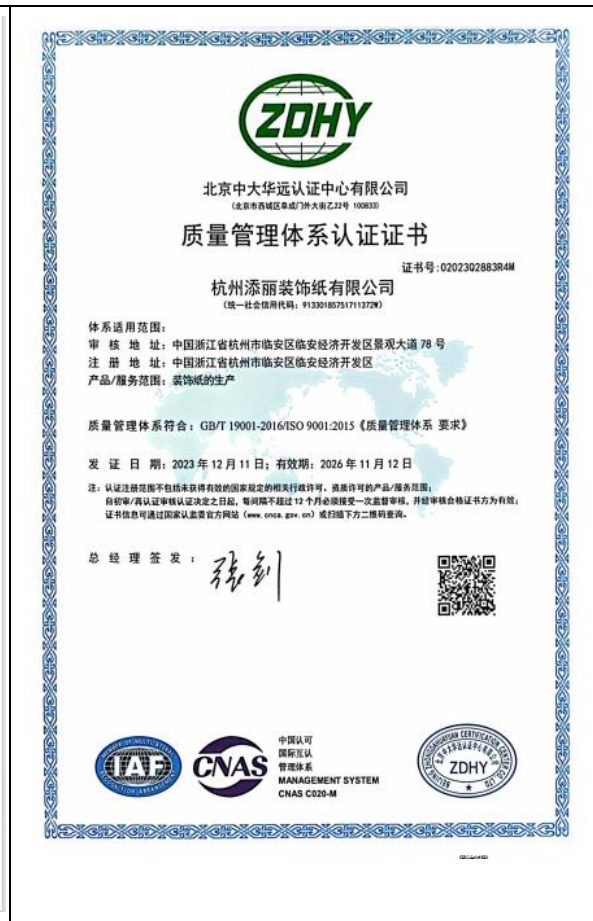
质量管理体系证书